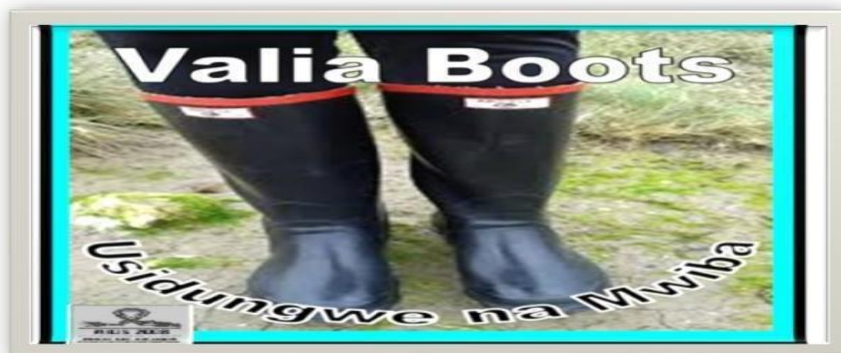
Kielelezo 3 (B3): “Valia Boots, Usidungwe na Mwiba”

rahisi na ya gharama nafuu ikilinganishwa na gharama za matibabu. Picha hizi zimechangia kuufanya ujumbe uwe wazi na kumwezesha msomaji kuelewa umuhimu wa kinga kupitia mifano halisi.