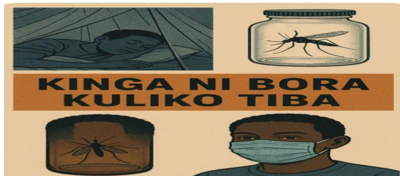
Kielelezo 2 (B2): “Kinga ni Bora Kuliko Tiba”

binadamu. Ni wazi kuwa muktadha una jukumu kubwa katika ufasiri wa ujumbe.