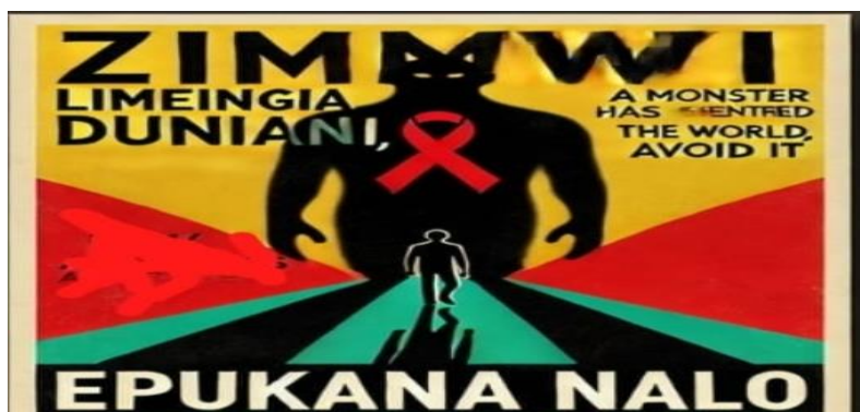
Kielelezo 5 (B5): “Zimwi Limeingia Duniani. Epukana Nalo”