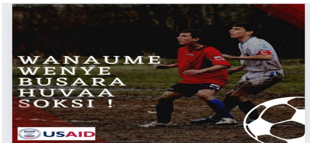
Kielelezo 4 (B4): “Wanaume Wenye Busara Huvaa Soksi!”

Wilson, 1986). Msomaji anahitaji kuelewa maana ya neno “mwiba” na “boots” kisha kuyahusisha na muktadha wa afya. Koech (2013) anasema kuwa maana hufasiriwa kulingana na muktadha. Kwa kurejelea muktadha wa afya, ni wazi kuwa “mwiba” umetumika kiisitiari kuashiria hatari fulani ya afya, na ili kuepukwa ni sharti kutumia kinga (“kuvaa boots”), ambapo “boots” pia ni isitiari inayorejelea mpira wa kinga (kondomu). Hivyo, ujumbe kwenye bango hili, kwa kutegemea muktadha, una maana ya “Tumia kondomu ili ujilinde usije ukaambukizwa.”